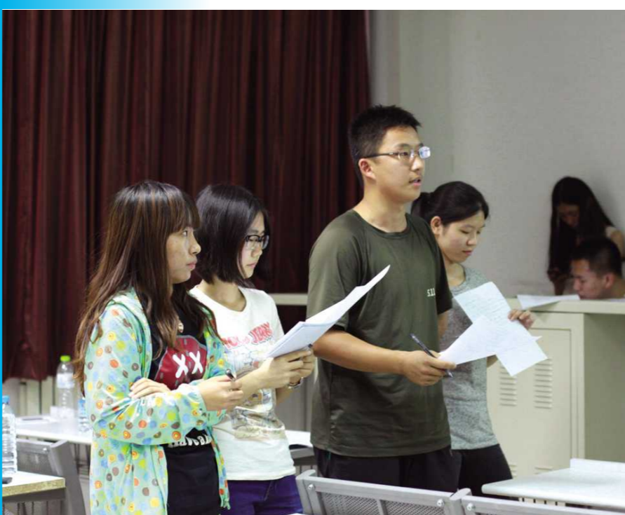
6月8日,我校“大学生外语新闻社与留学生中心第一届英文友谊辩论赛”于中关村校区研究生楼603教室举行。本次辩论赛辩题为“网络科技是利大于弊还是弊大于利”。大学生外语新闻社与留学生中心各派四位辩手参与比赛,充分准备的双方选手在三轮比赛中激烈交锋,比赛气氛紧张热烈。本次辩论赛的举办使辩手们在比赛中体验到思辨的乐趣,得到口才与思想的锻炼,促进了大学生外语新闻社国际交流合作部的人才选拔,进一步推进了大学生外语新闻社成员与留学生的交流与合作。