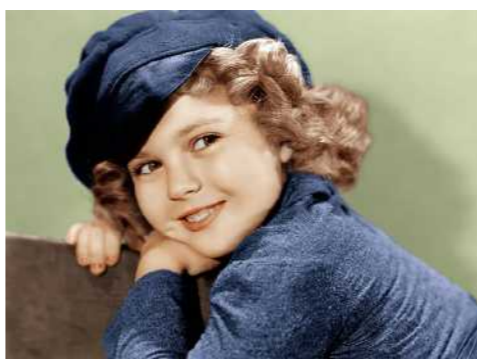
6岁她已经是风靡世界的好莱坞演员; 7岁她成为获得奥斯卡奖的第一个孩子; 80年前她开启了一个属于童星的时代; 80年后她仍是全世界怀念的天使; 成为世界第一童星,她究竟有哪些无与伦比的地方?

老梁总结:我对自己的要求是不一定永远说真话,但一定不能对着镜头说假话。大家都认为批评应该实事求是,可是赞美普遍不实事求是。作为一个知识分子,对真相要有洞察,绝对不能轻易给人抬轿子拍马屁。若是想更多的了解老梁眼中的名流,还是去看看《老梁谈名流》吧。(钟锦程)