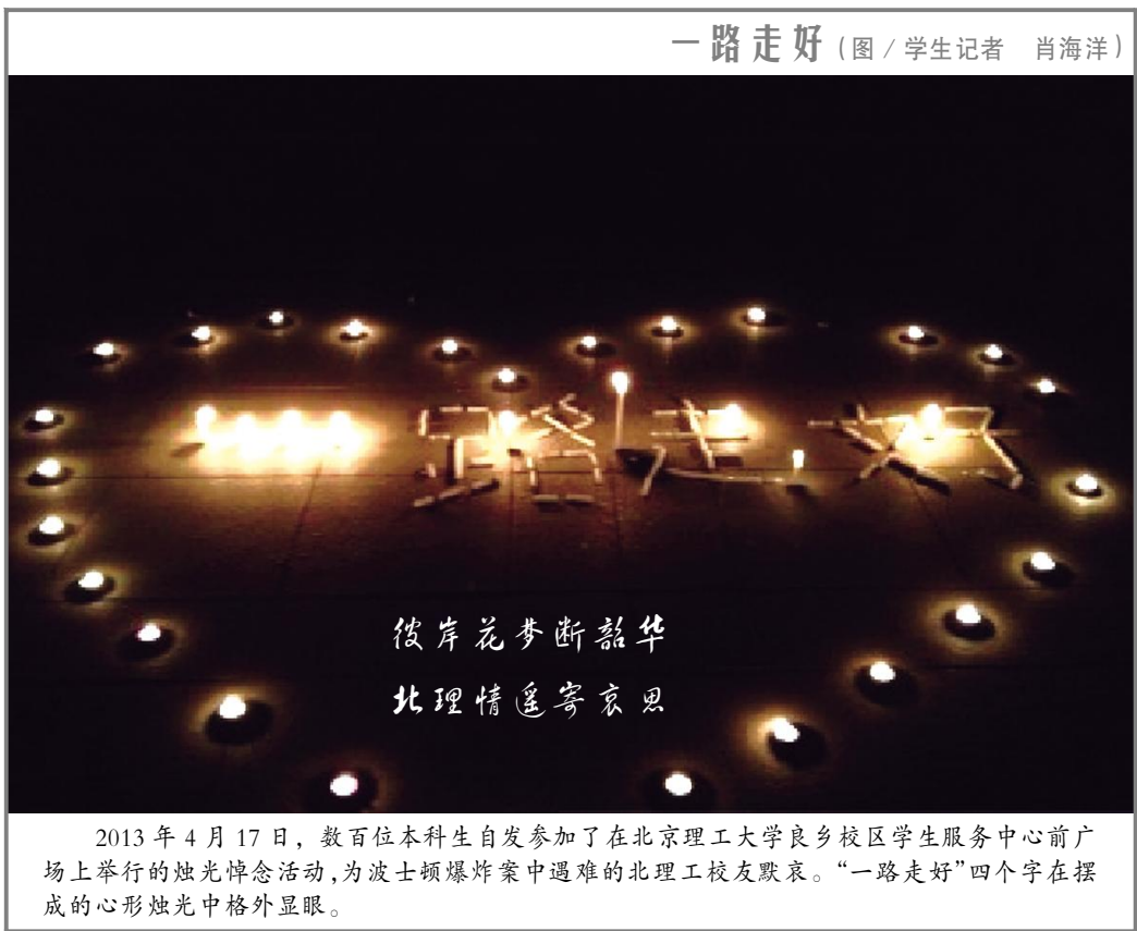
一路走好

三十年前,雄伟、壮观的六号楼曾以其博大的胸怀将我们悉数包容其中。我们涌入教室就像踏过一扇宝库之门,围向一盏启蒙之灯。“书山有路勤为径,学海无涯苦作舟”。我们站在楼顶就像立于巨人之巅,登上群峰之巅。“一览众山小”,“极目楚天舒”。